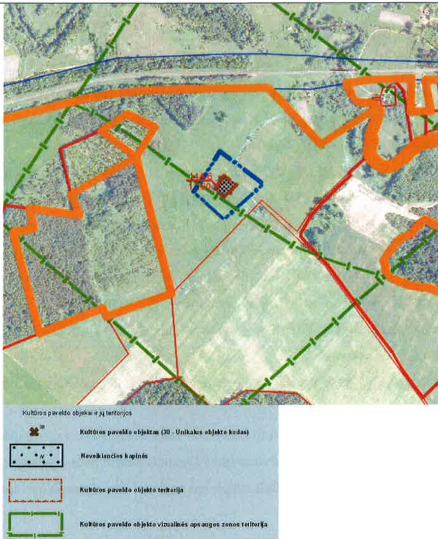
3.2.2.3. pav. Visginių kaimo neveikiančios kapinaitės, kurios patenka į žemės sklypą, kurio projektinis Nr. 144-6